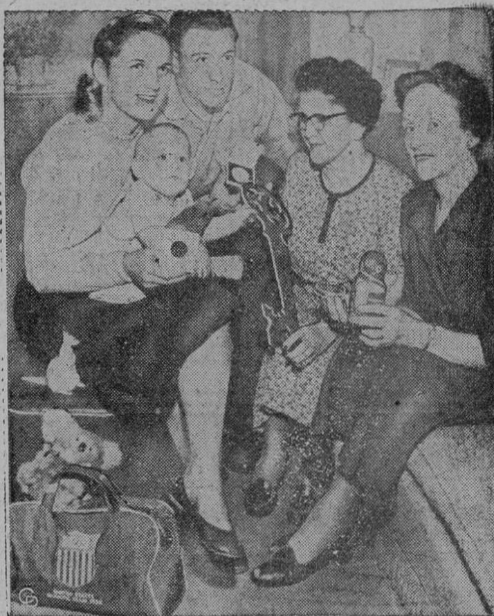
La señora Pat McCormick, de 26 años, que ganó dos medallas de oro en la Olimpiada de Melbourne regresa a su familia en Long Beach en California y anuncia su retiro de las competencias olímpicas.